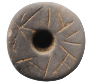
La rondella di Katua